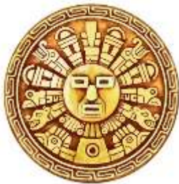
Símbolo de sol (Inca, Perú y Clima)